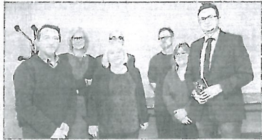
Les professionnels et encadrants ont permis la réalisation d'un ouvrage collectif.

Le travail en commun avait un objectif élevé : s'inscrire dans une philosophie liée à la culture et des projets devant être à la hauteur du Louvre-Lens, un partenaire. À l'été 2013, les acteurs du projet s'étaient rencontrés, mais la réalisation a, elle, commencé en janvier 2014. La première étape de la conception de ce